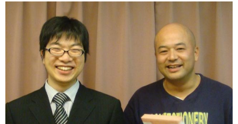
お世話になりました