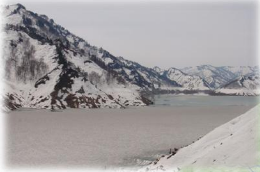
↑湖上に雪が残る奥只見湖 ↓急ピッチで除雪作業